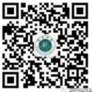
西京学院大学生 创业就业中心